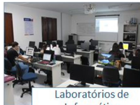
Laboratórios de Informática