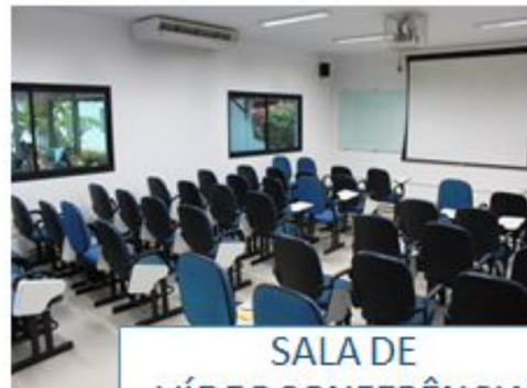
SALA DE VÍDEOCONFERÊNCIA