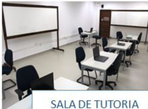
SALA DE TUTORIA